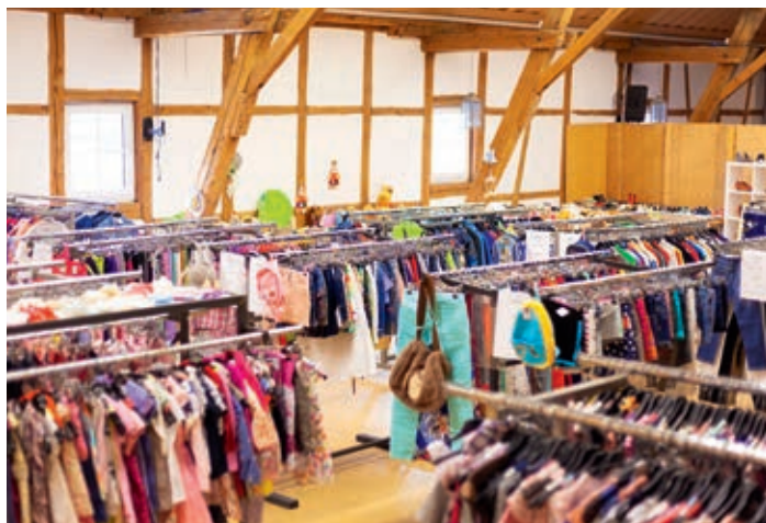
Im Secondhand-Modeshop wird die Kleidung weiterverkauft.