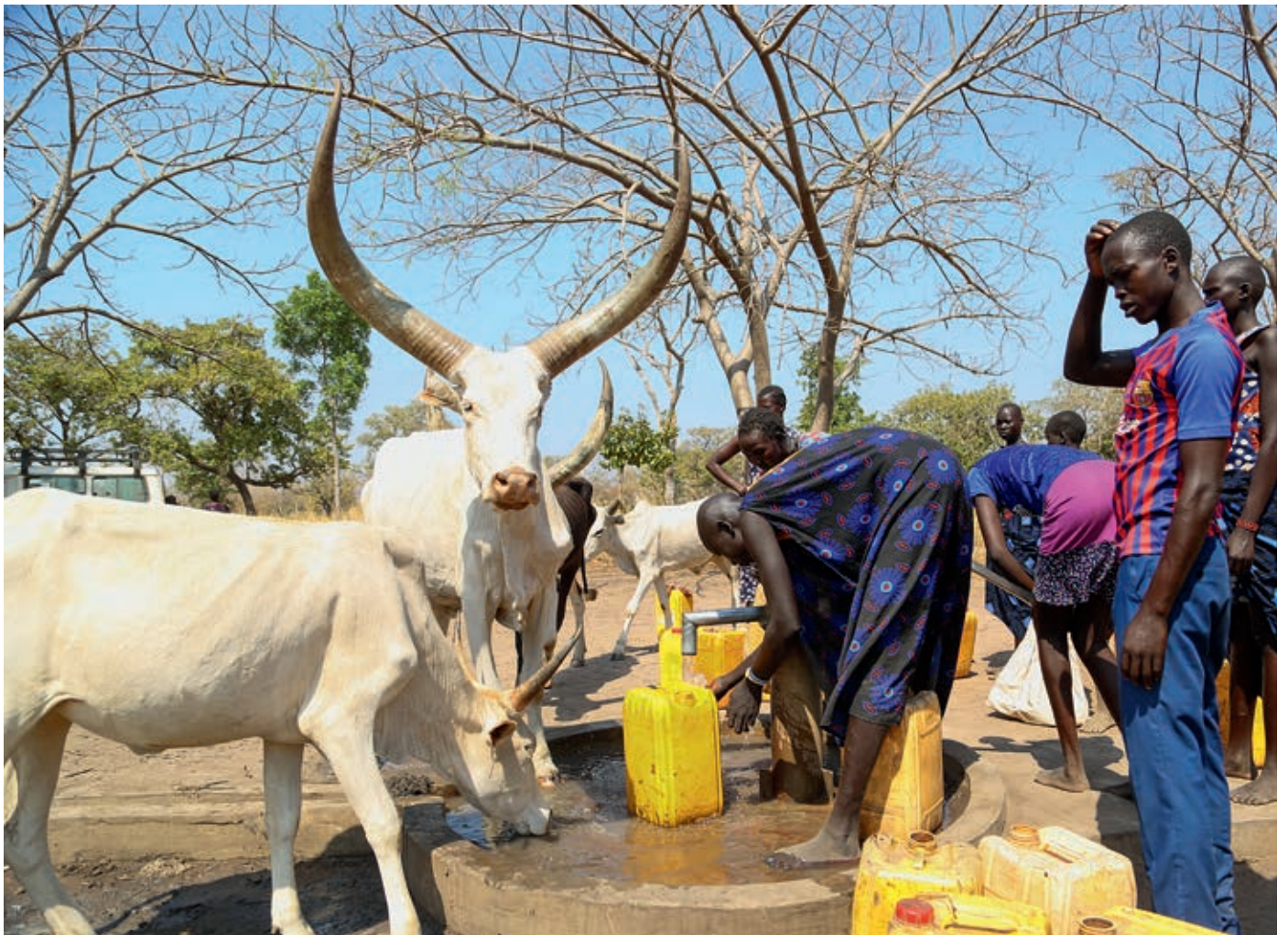
Im Südsudan holen viele Menschen ihr Wasser an Brunnen wie diesem.